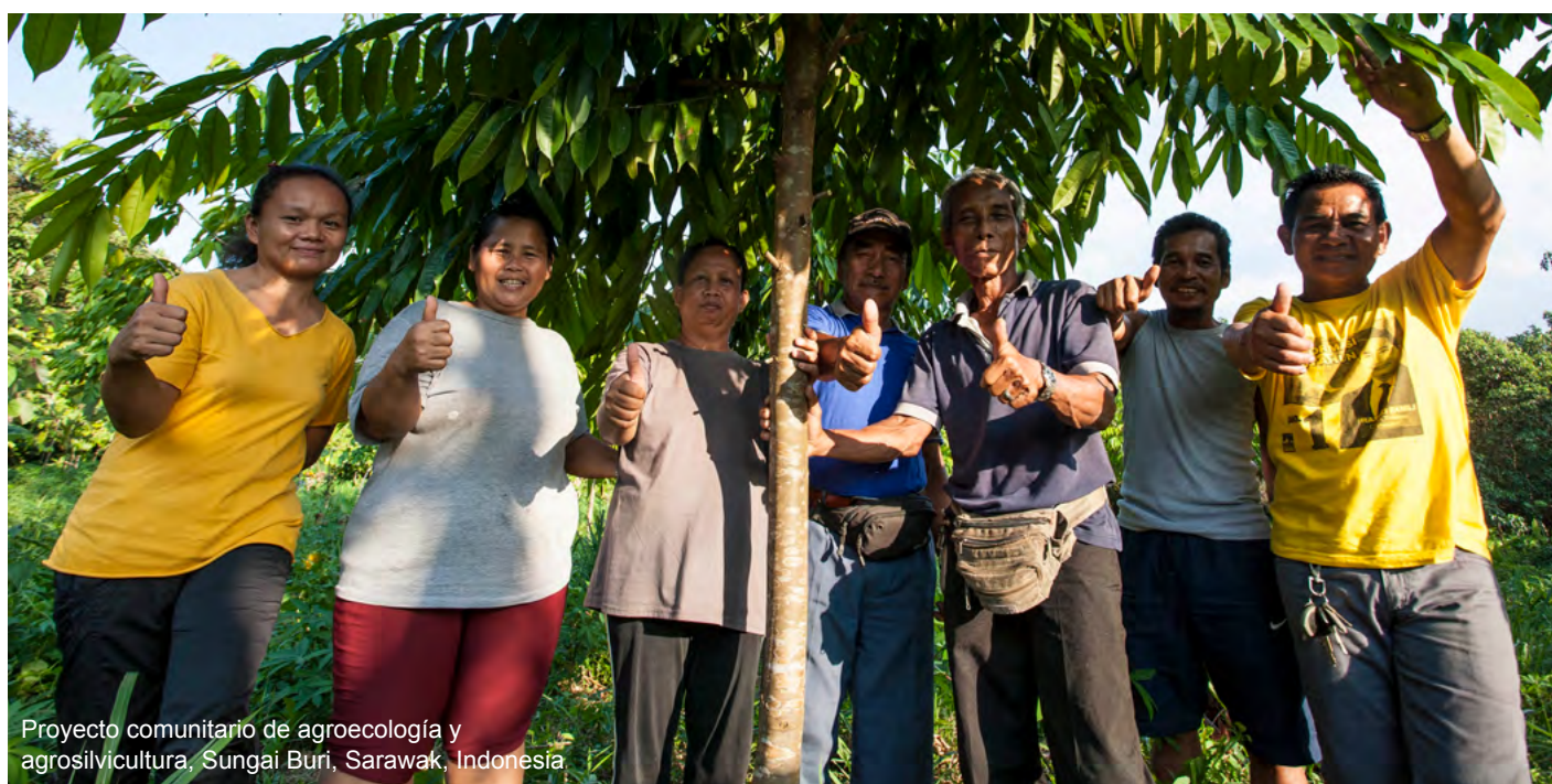
Proyecto comunitario de agroecología y agrosilvicultura, Sungai Buri, Sarawak, Indonesia