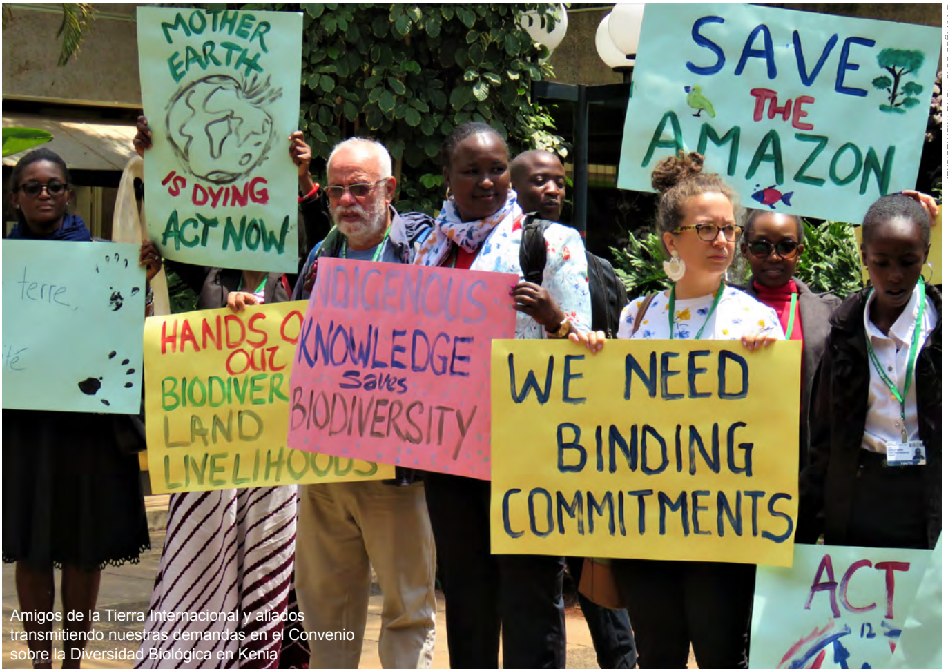
Amigos de la Tierra Internacional y aliados transmitiendo nuestras demandas en el Convenio sobre la Diversidad Biológica en Kenia

en naturaleza concebimos elementos que forman parte de una unidad. En determinados casos, según su experiencia, algunas personas más que otras sentirán la naturaleza más cerca de su ser. Sabemos que la naturaleza es una parte vital de nuestra existencia, no solo por las funciones que brinda y que son esenciales para la vida misma, también porque es de gran importancia para nuestro bienestar físico y mental 1 .