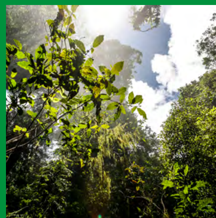
Amelia Collins/Amigos de la Tierra Internacional