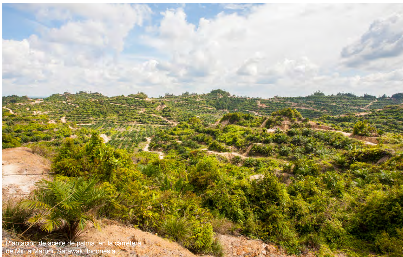
Plantación de aceite de palma, en la carretera de Miri a Marudi, Sarawak, Indonesia

Al asignarle un precio a la naturaleza y a las funciones