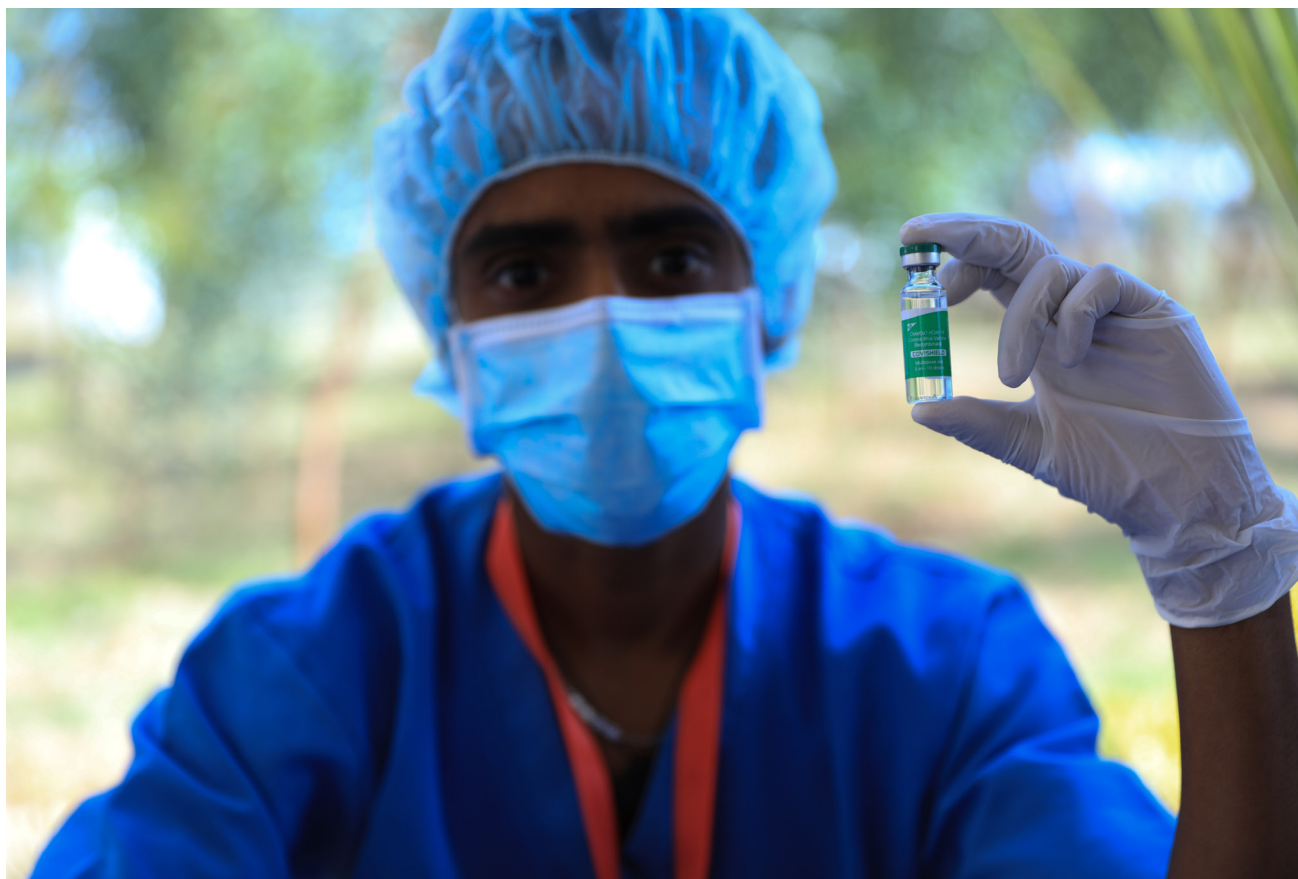
Programa nacional de lanzamiento de introducción de la vacuna contra la COVID 19 en el Hospital Eka Kotebe, Adís Abeba, 13 de marzo de 2021

de las vacunas y el poder de compra de los países más ricos, probablemente deje sin vacunas adecuadas a los países y pueblos que recurrieron al COVAX, incluso hasta el 2023 y 2024. Con el cúmulo de expectativas que ha generado entre el público, ¿cuáles serán las consecuencias políticas factibles? Los gobiernos de los 92 países y gobiernos donantes posiblemente no limiten sus denuncias al comité gubernamental asesor del COVAX. Es mucho más probable que hagan públicas sus quejas en un foro abierto como la Asamblea Mundial de la Salud o la Asamblea General de la ONU. Estas quejas internacionales bien pueden impulsarlas gobiernos que necesitan dar respuesta a la oposición e ira nacional porque su ciudadanía no está recibiendo oportunamente las vacunas internacionales 'prometidas'. Cobra vida así entonces una de las funciones no declaradas del sistema multilateral y las decisiones de sus mandos ejecutivos de participar en el COVAX: absorber las quejas públicas. El sistema de la ONU, profundamente lastimado de otras maneras por la epidemia de COVID, no necesita más publicidad negativa por proteger al COVAX y sus patrocinadores.