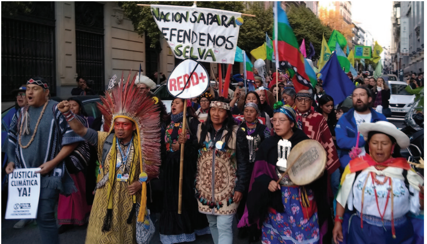
Des leaders de mouvements autochtones manifestent contre les mécanismes de tarification du carbone de l'Article 6, REDD+ et d'autres fausses solutions, pendant la marche mondiale pour le climat à Madrid, lors de la Cdp 25 de la CCNUCC, en décembre 2019.