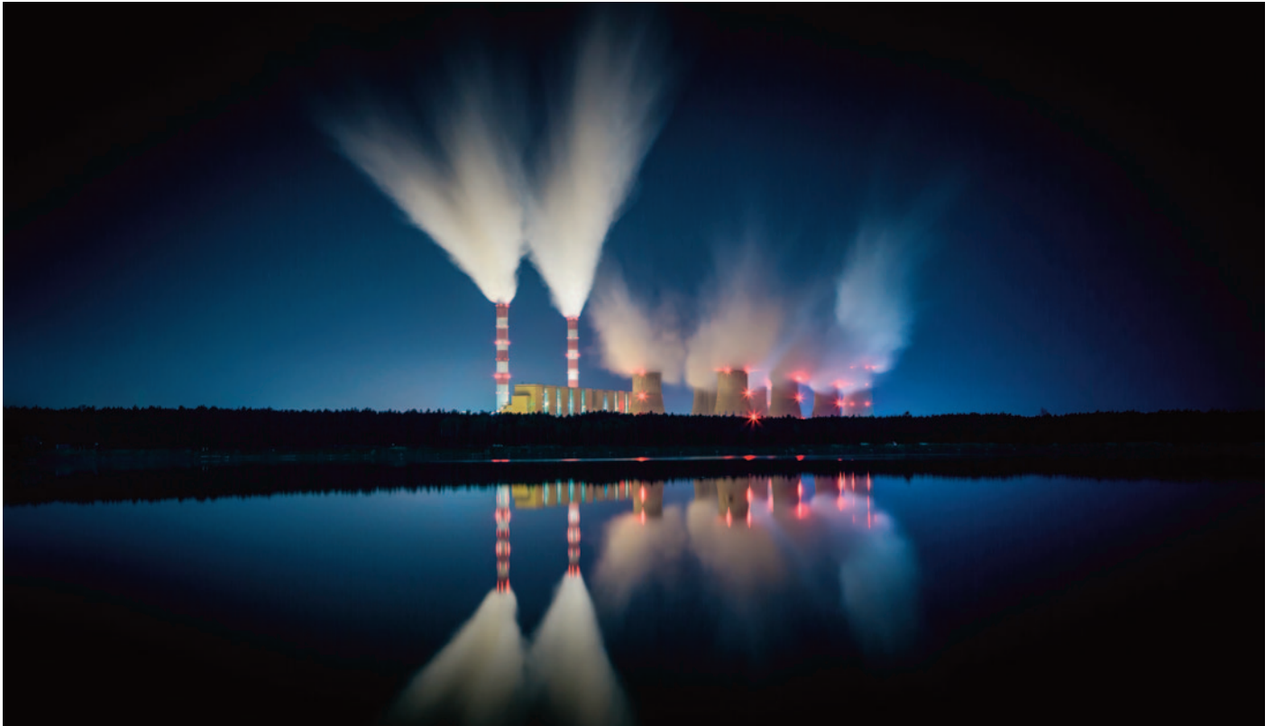
Une centrale à charbon, de nuit en Pologne.

L'article 4.1 de l'Accord de Paris stipule : En vue d'atteindre l'objectif de température à long terme énoncé à l'article 2 1 , les Parties cherchent à parvenir au plafonnement mondial des émissions de gaz à effet de serre dans les meilleurs délais, étant entendu que le plafonnement prendra davantage de temps pour les pays en développement Parties, et à opérer des réductions rapidement par la suite conformément aux meilleures données scientifiques disponibles de façon à parvenir à un équilibre entre les émissions anthropiques par les sources et les absorptions anthropiques par les puits de gaz à effet de serre au cours de la deuxième moitié du siècle, sur la base de l'équité, et dans le contexte du développement durable et de la lutte contre la pauvreté.