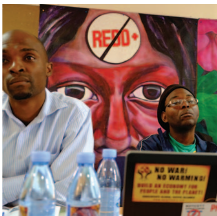
Réunion « NO REDD » à Maputo (Mozambique) en 2013.