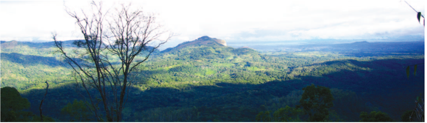
La forêt de Mabu, dans le centre du Mozambique.

Une certaine quantité de carbone devra être éliminée pour maintenir le réchauffement en dessous de 1,5 °C, eu égard aux émissions résiduelles de secteurs tels que l'agriculture qui ne pourront pas atteindre le zéro absolu. L'ampleur de l'élimination requise dépendra de la rapidité avec laquelle les émissions mondiales atteindront zéro, ou s'en approcheront le plus possible (se reporter à l'encadré sur les stratégies de décryptage du vrai et du faux zéro). À l'heure actuelle, les seules approches permettant une véritable élimination du carbone sont fondées sur la nature : la restauration des écosystèmes et la gestion écologique des forêts, des terres cultivées et des prairies en activité. Le terme « vrai zéro » englobe ces deux exigences : ramener les émissions aussi près de zéro que possible, et avoir recours à des approches écologiques pour éliminer les émissions résiduelles.