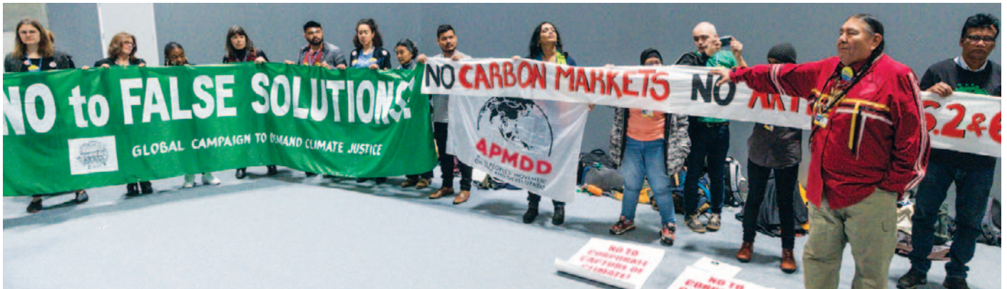
Des militants dénoncent les marchés du carbone à l'occasion des négociations sur le climat de la COP25 à Madrid, en décembre 2019.

De nombreux processus sont en cours pour faire intégrer la nature aux marchés du carbone afin de satisfaire les « besoins » générés par l'adoption de promesses, d'objectifs et de justifications de « zéro émission nette ». Il s'agit notamment des processus volontaires décrits plus haut, avec le groupe de travail sur l'élargissement des marchés volontaires du carbone (TSVCM), mais aussi de mécanismes de négociation intergouvernementaux formels, en particulier dans le cadre de la Convention des Nations unies sur la diversité biologique (CDB) et de la Convention-cadre des Nations unies sur les changements climatiques (CCNUCC). 34