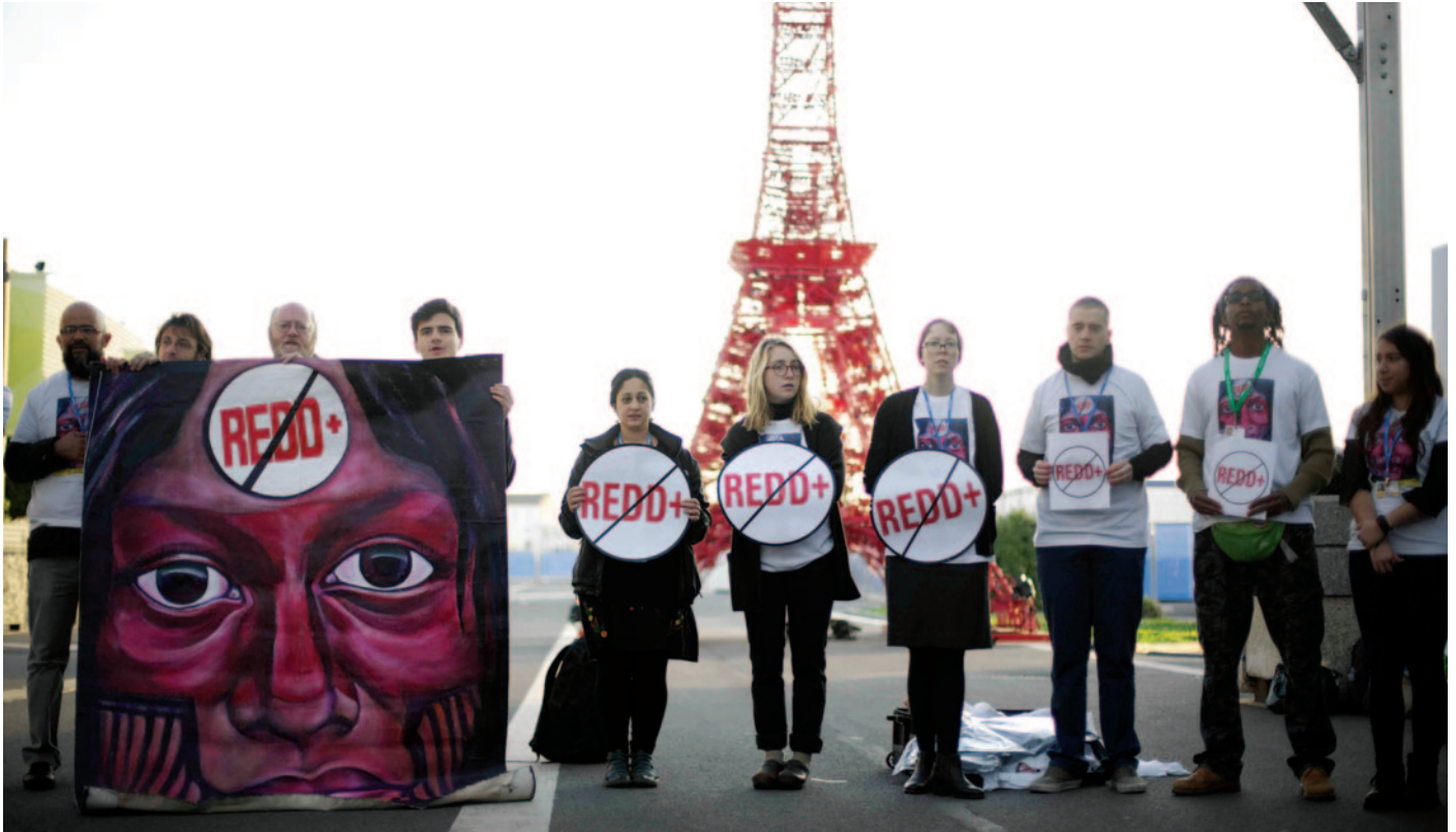
Des militants manifestent contre REDD et les accaparements de terres avant la signature de l'Accord de Paris, lors des négociations sur le climat de la COP21 à Paris, en décembre 2015.

Les gouvernements se fixent eux aussi des objectifs à « zéro émission nette » dans le cadre des mesures qu'ils prennent conformément à l'accord de Paris, souvent par l'intermédiaire de leurs contributions nationales déterminées (CND). Les stratégies pour y parvenir sont plus variées que l'utilisation de mesures compensatoires achetées sur le marché du carbone.