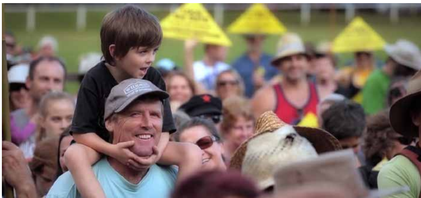
Amigos de la Tierra Australia

Para afirmar y celebrar el resultado, organizaron un evento especial en el óvalo deportivo de la ciudad para declarar el área 'Gasfield Free'. En los eventos de declaración, las comunidades se anunciaron a sí mismas como "Gasfield Free – Protegido por la Comunidad". Los eventos se llevaron a cabo como una celebración de la comunidad: de lo que habían logrado pero también de todo lo que amaban sobre su comunidad y sus tierras. Entregaron los resultados de la votación a las autoridades locales, ya fueran alcaldes de municipios o políticos estatales. La declaración no era solo una encuesta o una petición,