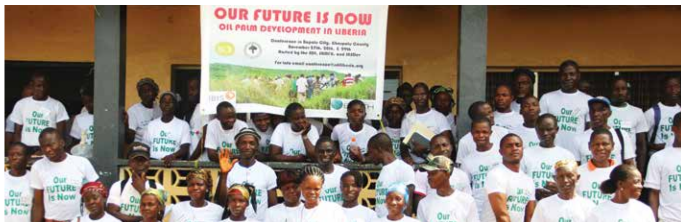
Amigos de la Tierra Internacional

Las luchas por la liberación de nuestros territorios son procesos políticos que demandan mucho trabajo. No es fácil obtener una declaración en tal sentido desde una autoridad nacional. Tampoco es fácil desde los movimientos, hacer una declaración de ese tipo. En ambos casos, tampoco es fácil mantenerla en el tiempo. Y a pesar de la dificultad de este trabajo, son numerosas las comunidades que junto a sus organizaciones y movimientos sociales, vienen declarando libres sus territorios desde hace muchos años. Esto nos demuestra que este trabajo es posible y se está haciendo. A través de procesos como estos, es que se hace posible la construcción de nuevos paradigmas y nuevos mundos.