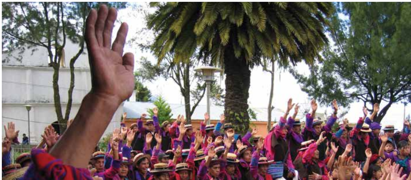
CEIBA, Amigos de la Tierra, Guatemala

no es así. Al mismo tiempo, a veces no se da tiempo para que la comunidad con sus tiempos, pueda analizar -junto a gente de su confianza- la información recibida de acuerdo a sus formas tradiciones de discusión y toma de decisiones. Así, a veces, este instrumento y Derecho, puede ser utilizado en forma negativa.