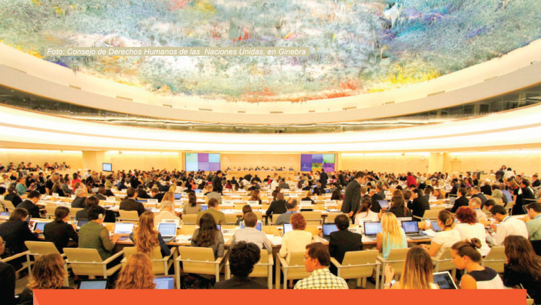
Foto: Consejo de Derechos Humanos de las Naciones Unidas, en Ginebra