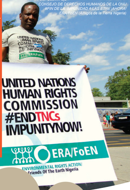
Foto: Movilización contra la impunidad de las transnacionales en frente al Palacio de las Naciones en Ginebra

CONSEJO DE DERECHOS HUMANOS DE LA ONU #FIN DE LA IMPUNIDAD A LAS ETNs ¡AHORA! ERA/FoEN (Amigos de la Tierra Nigeria)