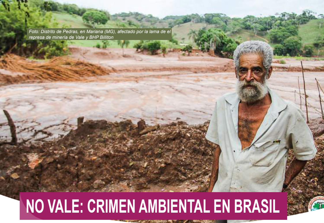
Foto: Distrito de Pedras, en Mariana (MG), afectado por la lama de el represa de minería de Vale y BHP Billiton