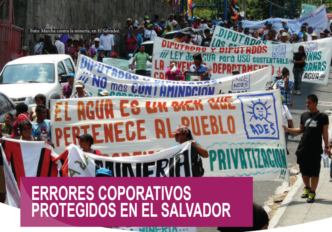
Foto: Marcha contra la minería, en El Salvador.