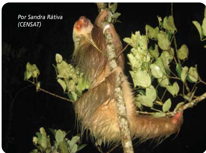
Por Sandra Rátiva (CENSAT)