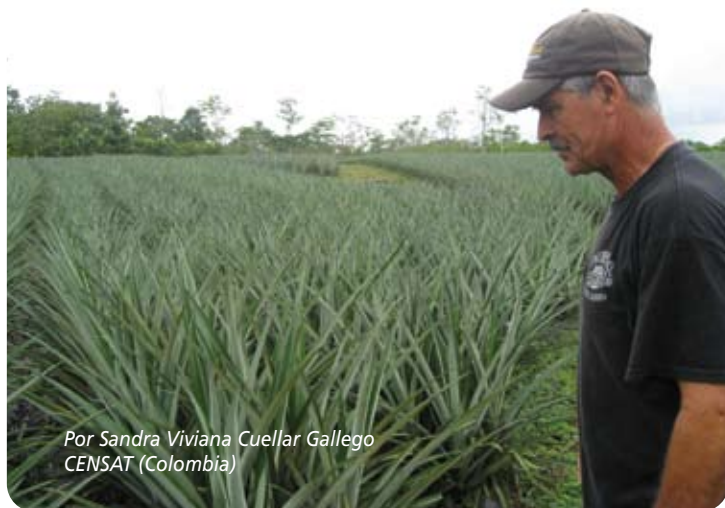
Por Sandra Viviana Cuellar Gallego CENSAT (Colombia)

Sean las 8:30 am del 10 de Julio de 2009, para que un conocedor de la geografía y biología costarricense nos guiara en un viaje imaginario por nuestra Sur y Centro América (aquella que ya no se encuentra en los mapas educativos quizá como estrategia de dominación para borrar de nuestros imaginarios la idea de un territorio unido, para localizarnos en Costa Rica, en la ciudad de San José y describirnos el camino hacia la comunidad de Juanilama, donde llevaríamos a cabo la tercera sesión presencial de la Escuela de la Sustentabilidad de Amigos de la Tierra América Latina y Caribe (ATALC).