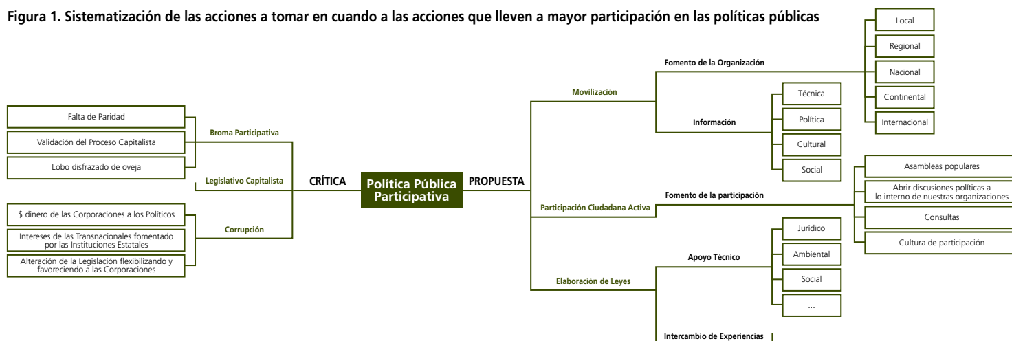
Figura 1. Sistematización de las acciones a tomar en cuando a las acciones que lleven a mayor participación en las políticas públicas