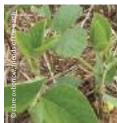
Toma de aproximación a una planta de soja recién fumigada en Paraguay.