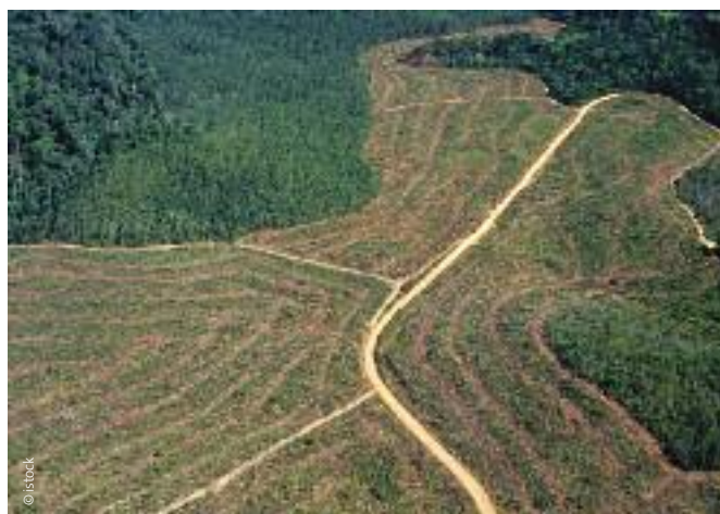
Deforestación en Brasil.

Algunos agricultores estadounidenses están utilizando incluso Paraquat y 2,4-D (un componente del Agente Naranja) en los cultivos de soja transgénica.