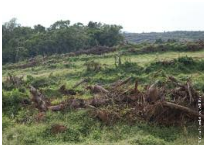
Zona deforestada para cultivar aceite de palma en las islas Kangala, lago Victoria (Uganda).

En el apéndice se añade una lista exhaustiva de ejemplos de acaparamientos de tierras para la producción de agrocombustible.