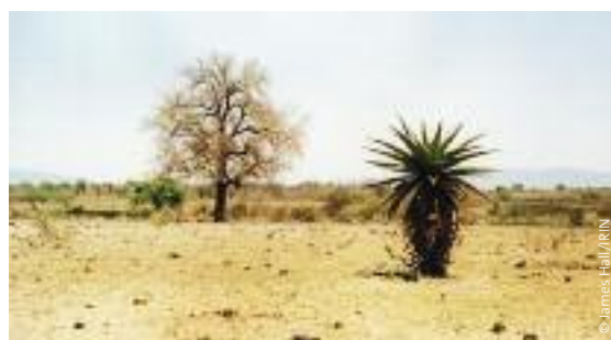
Desertificación: antiguas tierras de cultivo, Suazilandia.

En Nigeria, los planes para establecer plantaciones de azúcar de caña en el estado de Gombe han causado preocupación sobre el uso de pesticidas y el impacto en la agricultura de alrededor. 99