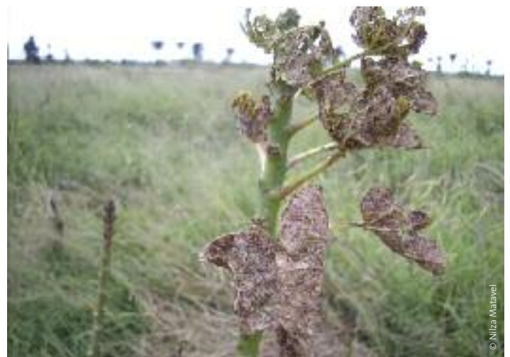
Jatrofa con plagas, distrito de Moamba (Mozambique).

Los campesinos de la União Nacional de Camponeses (UNAC) de Mozambique que han estado cultivando jatrofa, dicen haber obtenido un índice de crecimiento lento, una producción escasa y problemas de plagas. 89