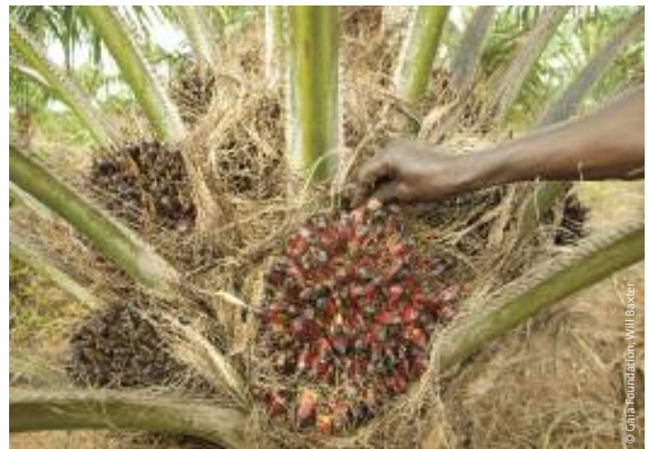
Fruto de aceite de palma.