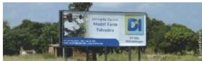
Proyecto de jatrofa en Mozambique. D1 Oils (Maputo).

La empresa conjunta de D1 Oils con el gigante del petróleo BP también vio su final cuando BP se retiró en 2009. 121