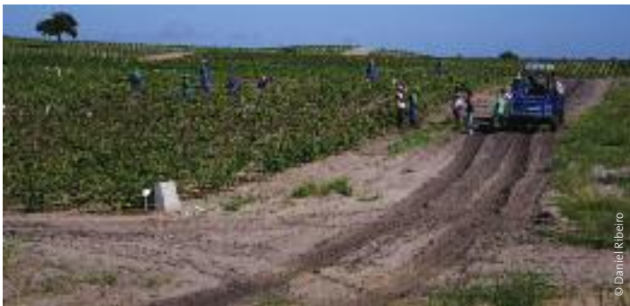
Trabajadores de Energem, comunidad Dzeve, distrito de Bilene (Mozambique).

En algunos casos, se acusa a las empresas extranjeras de abusar de las leyes locales que protegen los derechos de los trabajadores. Sun Biofuels, también de Mozambique, emplea a 430 trabajadores en las plantaciones de jatrofa con 45 horas semanales y jornadas más largas de lo que permite la ley. 86