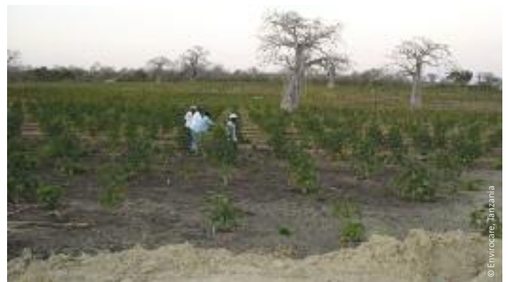
Campo de jatrofa Bioshape en Kilwa, Tanzania.

Un factor clave todavía más importante es la tierra fértil con suministros de agua disponibles. Aunque se dice que los cultivos de agrocombustible como la jatrofa y el sorgo dulce crecen bien en tierras marginales, muchos de los acaparamientos de tierra para cultivos de agrocombustibles ocupan tierras que se habían utilizado para agricultura con anterioridad.