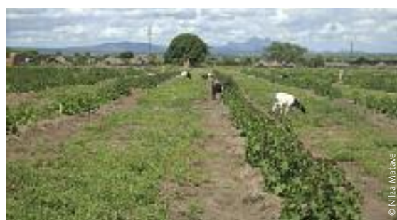
Sun Biofuels – Manica, Mozambique.