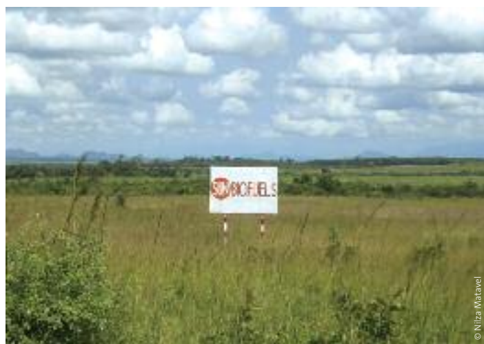
Ejemplos de los proyectos de jatrofa en Mozambique. Sun Biofuels.