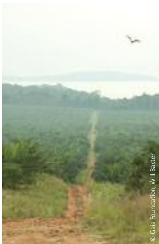
Plantación de aceite de palma de BIDCO en las Islas Kalangala, Lago Victoria, Uganda.

Estas cuestiones se tienen que evaluar de manera objetiva. No debemos aceptar estos argumentos sin someterlos a un análisis empírico. El fundamento de esta investigación parte de esta premisa; se centra en la expansión de la producción de agrocombustibles en toda África y pone de manifiesto los problemas que ello genera en la sociedad, la economía, la salud y el medioambiente.