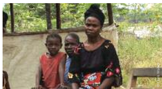
Congoleños que viven en los alrededores de M'Boundi.

En Tanzania, en 2009, obligaron a miles de agricultores de arroz y de maíz a abandonar sus tierras, y en diversas zonas del país han amenazado con desalojarlos para plantar caña de azúcar. Más de mil agricultores de arroz tuvieron que abandonar sus tierras de las llanuras de Usangu en 2009, lo que generó numerosos conflictos. Alrededor del mismo número de agricultores fueron desalojados de Wami Basin para llevar a cabo unos planes de plantación. 58 Las empresas europeas, respaldadas por la iniciativa energética de la UE y con la ayuda económica del Reino Unido y los Estados Unidos, están detrás de algunos de éstos proyectos. 59 También se han propuesto plantaciones de jatrofa y de girasoles. Las protestas de los campesinos han conseguido que el gobierno de Tanzania recapacite sobre su perspectiva hacia los agrocombustibles. 60