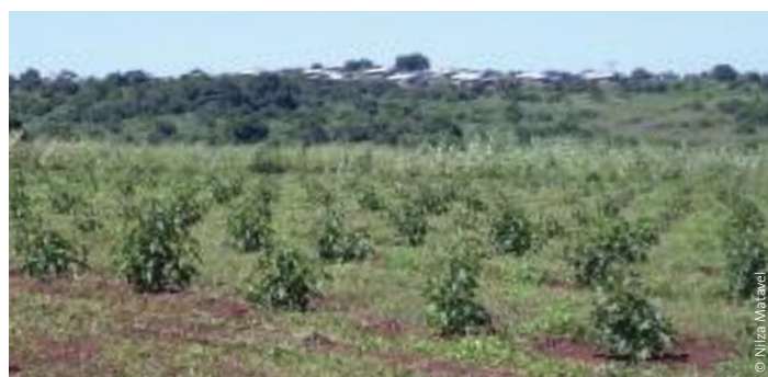
Plantación de MoçamGalp en Mozambique.

El Grupo Intergubernamental de Expertos sobre el Cambio Climático (IPCC) ha previsto la probabilidad de que ciertas partes de África se vuelvan más áridas y con menos precipitaciones a causa del cambio climático. La superficie de tierra africana clasificada como «seca» podría aumentar hasta 90 millones de hectáreas. La falta de agua afectará al rendimiento de los cultivos e imposibilitará la ganadería en muchas zonas. 109