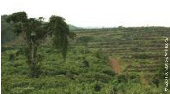
Plantación de aceite de palma de BIDCO en las Islas Kalangala, Lago Victoria, Uganda.

Al igual que ya sucedió con la economía africana cuando se explotaron los combustibles fósiles y otros recursos naturales para beneficio de otros países, existe el riesgo de que los agrocombustibles se exporten al extranjero con un beneficio mínimo para las comunidades locales y para las economías nacionales. Los países se quedarán con suelos degradados, ríos drenados y bosques devastados.