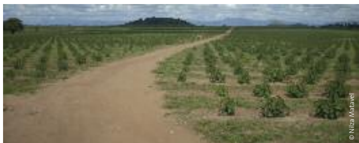
Plantación de jatrofa de SunBiofuels.

La preocupación por el abastecimiento de energía parece ser la principal razón por la que los agrocombustibles están tan demandados, además de que la UE ha fijado el 2010 como fecha límite para conseguir que el 10% del combustible de transporte provenga de fuentes «renovables». Estos objetivos europeos han establecido un mercado definido, ya que, dados el precio de la tierra y la ausencia de tierras disponibles dentro de la UE, será necesario recurrir a las importaciones para que se cumplan.