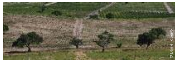
Plantación de Energem, comunidad Dezeve, Distrito de Bilene (Mozambique.)

¿Cultivos para la exportación o seguridad energética? Senegal ha puesto en marcha un programa nacional de biocombustibles (National Biofuel Programme) y Nigeria ha establecido un objetivo nacional por el que en 2020, utilizará para el transporte hasta el 10% de los agrocombustibles que se producen en su país. Otros países, entre los que se encuentran Mozambique y Ghana, también parecen haber acogido los agrocombustibles con entusiasmo. No es raro que Mozambique considere los agrocombustibles, en especial la jatrofa, como un medio para reducir la dependencia de las importaciones de combustible. 35