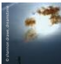
Izquierda: Pozo de gas natural quemando gas antes que se tape el pozo para ponerlo en producción, Texas, EEUU. Derecha: Bombas de extracción en campo petrolero.

De todos modos, el Banco está avanzando con sus actividades relacionadas con el cambio climático. Quizá tenga que ver con que entre 2005 y 2007, estuvo cobrando en promedio un 13% de “cargos generales” a proyectos de reducción de emisiones, que se traducen en ingresos para el Banco de aproximadamente US$260 millones por proyectos destinados a resolver un problema que el propio Banco está ayudando a crear. (SEEN, 2008)