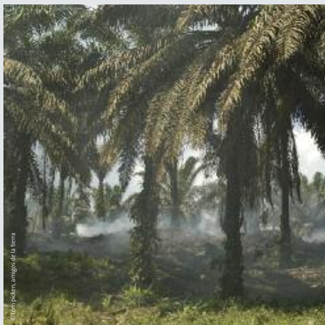
© tom picken, amigos de la tierra