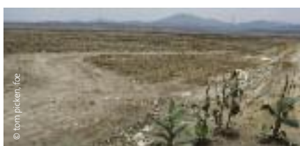
Left: Tanque cisterna con aceite crudo de palma, Indonesia. Right: Desmonte para dar lugar a plantaciones de palma aceitera en Indonesia.