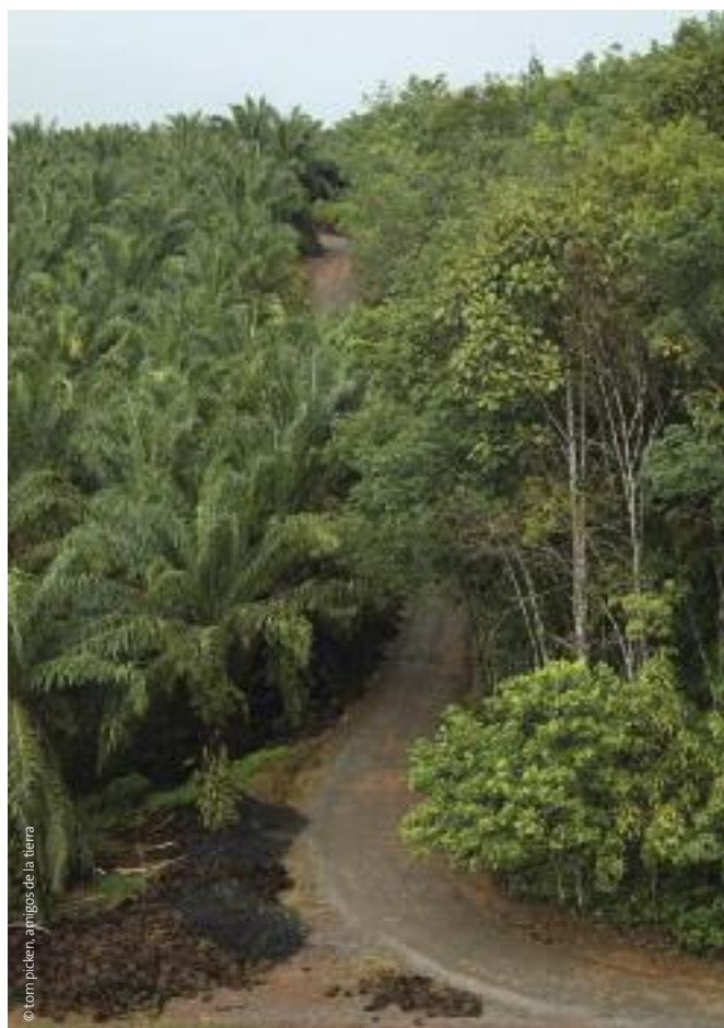
Camino flanqueado de un lado por una plantación de palma aceitera, y del otro lado por un bosque, Indonesia

Este fondo incorpora una Prioridad Estratégica de Adaptación que tiene como objetivo reducir la vulnerabilidad e incrementar la capacidad de adaptarse al cambio climático, apoyando proyectos piloto y proyectos demostrativos que aborden las necesidades locales de adaptación y generen beneficios ambientales globales. El fondo contiene US$50 millones. (Action Aid, 2007)