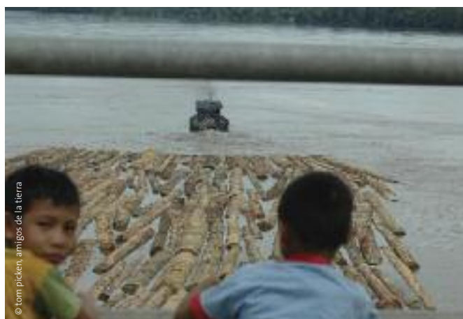
Troncos de madera talados en los bosques en Indonesia.

Otra preocupación esencial es que REDD podría invalidar de hecho los esfuerzos actuales de mitigación del cambio climático, si se lo financia con la venta de créditos de carbono de los bosques en los mercados internacionales regulados.