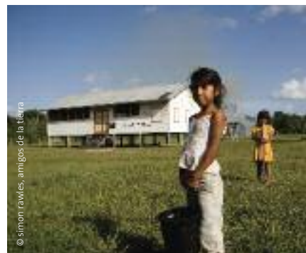
Izquierda: Desmonte para dar lugar a plantaciones de palma aceitera en Indonesia. Derecha: Familia que vive en las inmediaciones del bosque de Iwokrama en Guyana.